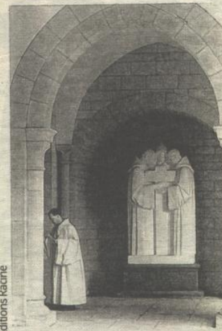
Une des photos dans le livre de Thierry Renaud sur l'abbaye d'Orval.

Thierry Renaud, le photographe, est soucieux du recueillement