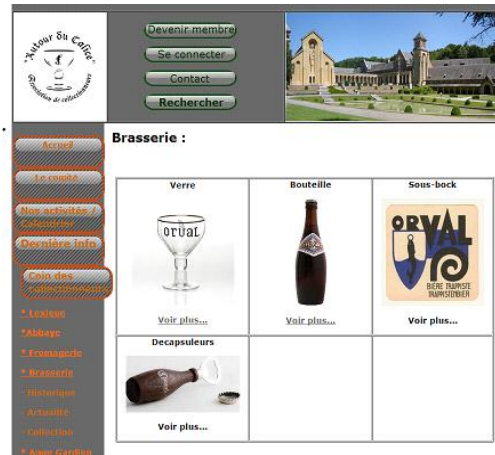
Brasserie – collection – verres