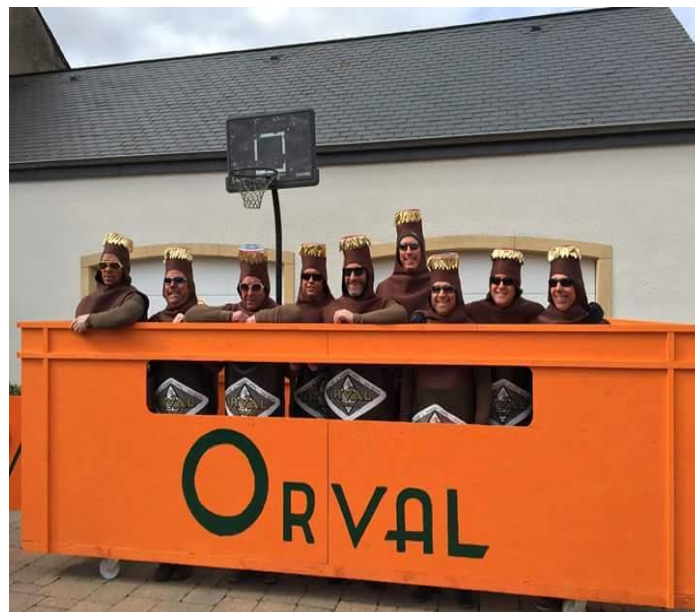
Vu cette année au carnaval d'Heinstert.