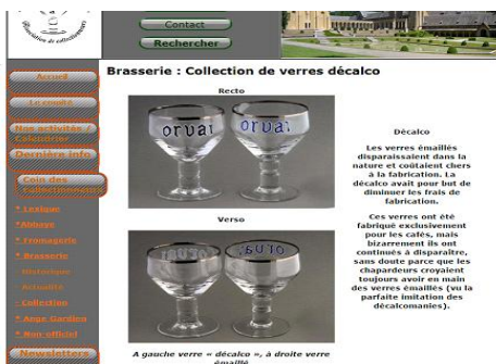
Brasserie – collection – verres - décalco