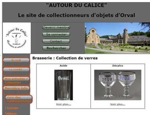
Section Brasserie – collection